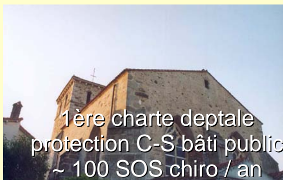
1ère charte deptale protection C-S bâti public ~ 100 SOS chiro / an