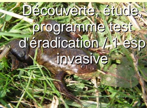
Découverte, étude, programme test d'éradication / 1 esp invasive