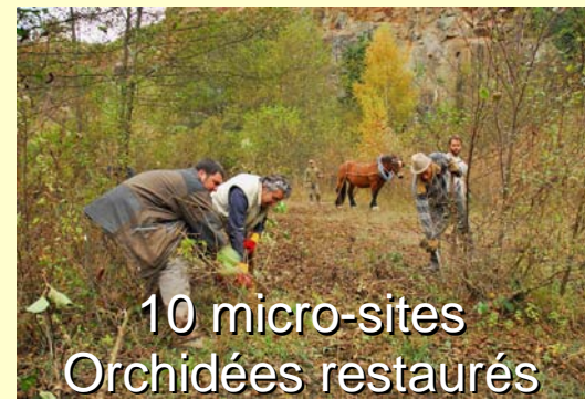
10 micro-sites Orchidées restaurés